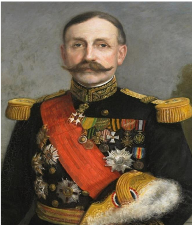
Général d'armée Augustain DUBAIL en grande tenue modèle 1872 avec bicorne à plumes blanches.

En 2021 , la section de l'Hérault de la Société des membres de la Légion d'Honneur placera les maîtres d'apprentissage, les enseignants, les bénévoles associatifs sportifs et culturels, transmetteurs des savoirs, des valeurs et des traditions de la Nation auprès des jeunes, au cœur des manifestations du Centenaire.