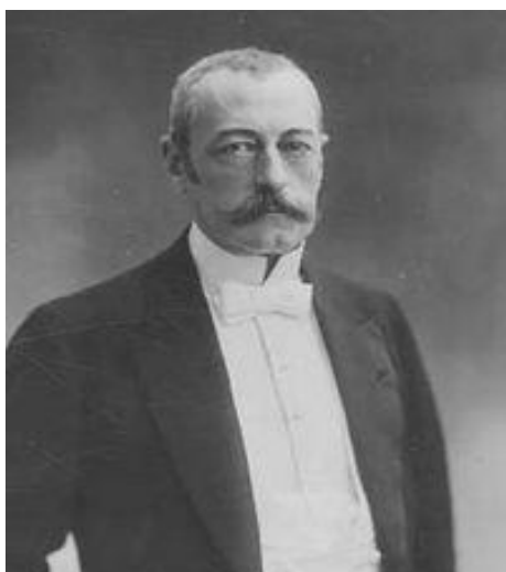
Pierre WALDECK ROUSSEAU Père de la loi du 1 er juillet 1901 sur les associations.

1981 : le président François MITTERAND abroge la loi de 1971 .